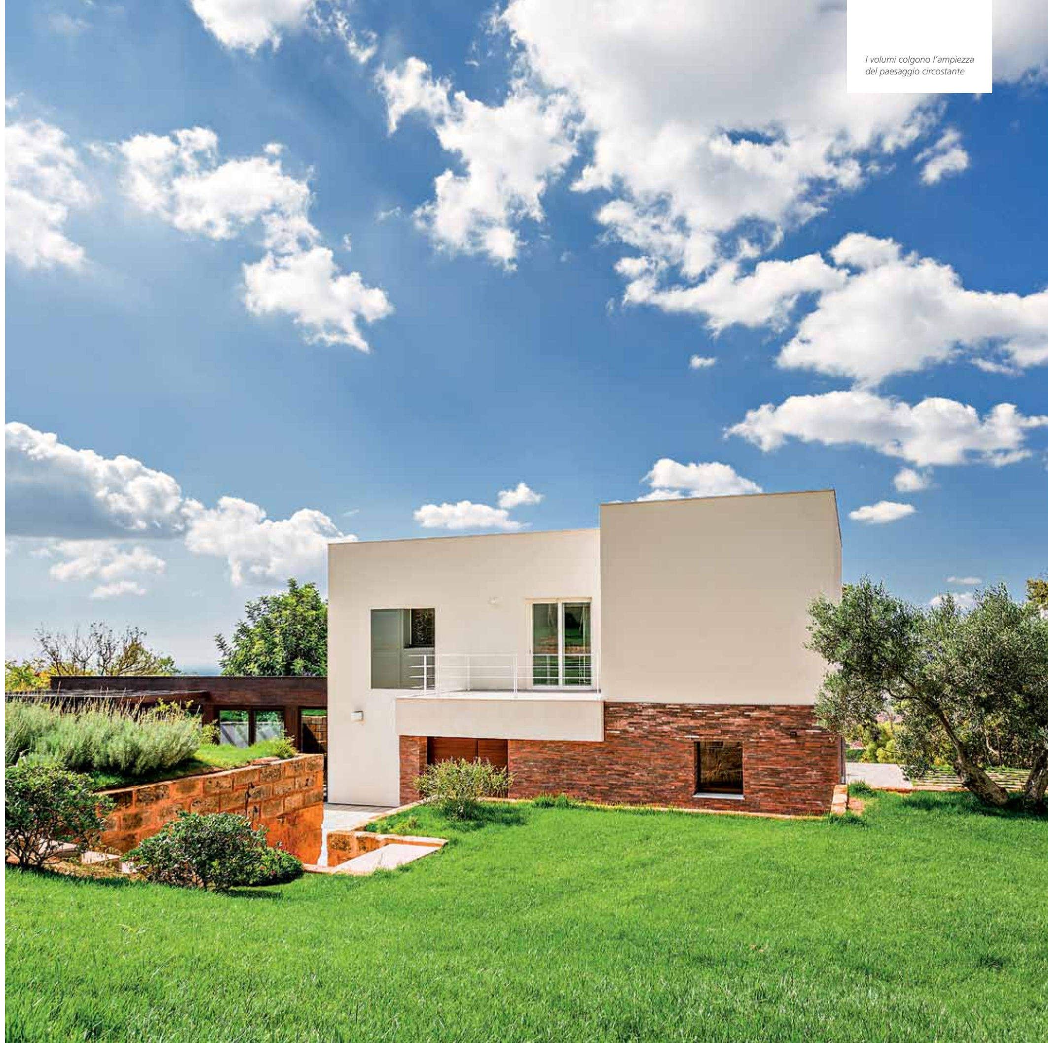
I volumi colgono l'ampiezza del paesaggio circostante