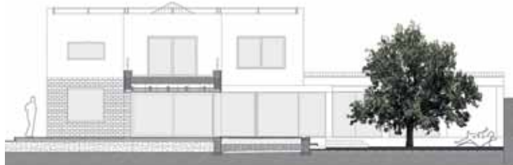
Masterplan di progetto e prospetti