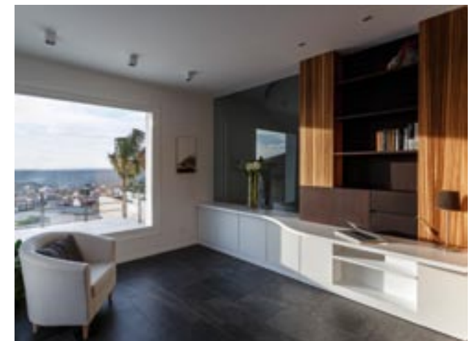
Nelle immagini sopra la zona studio. Nell'immagine accanto la vista del salone dalla scala.