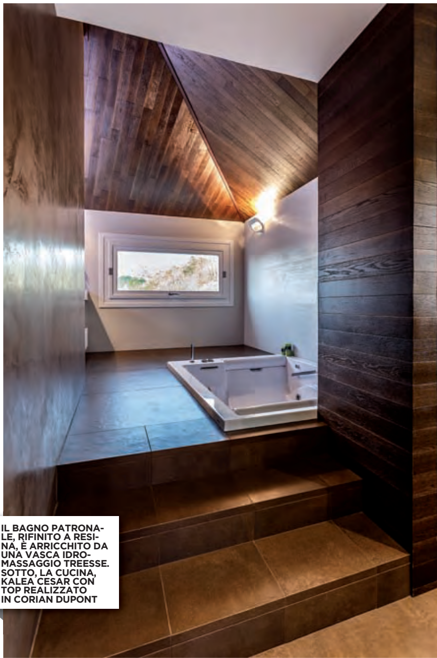
IL BAGNO PATRONALE, RIFINITO A RESINA, È ARRICCHITO DA UNA VASCA IDROMASSAGGIO TREESSE. SOTTO, LA CUCINA, KALEA CESAR CON TOP REALIZZATO IN CORIAN DUPONT